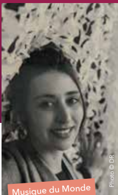
Musique du Monde