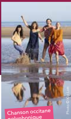
Chanson occitane polyphonique